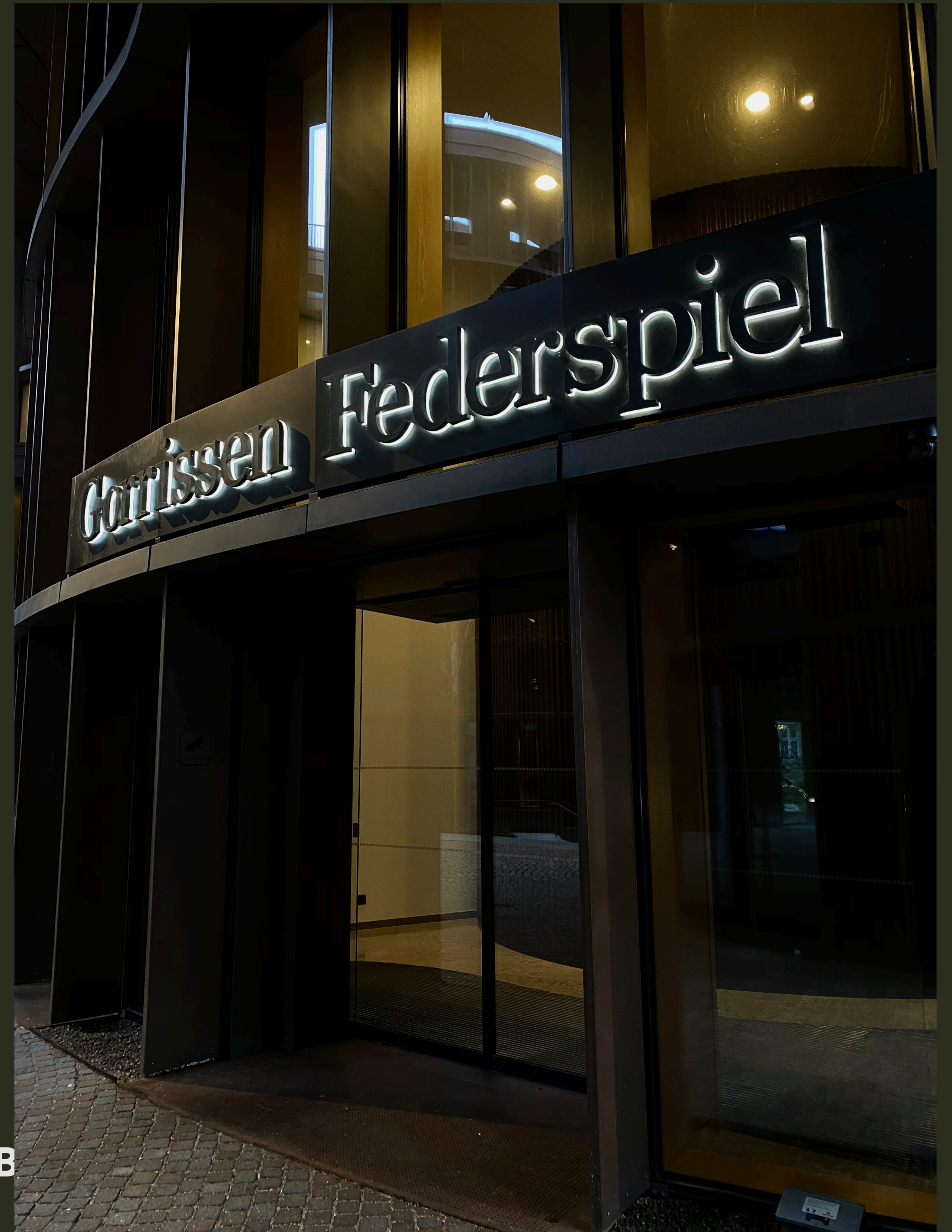
– Gorrissen Federspiel - Axel Tower, indgang